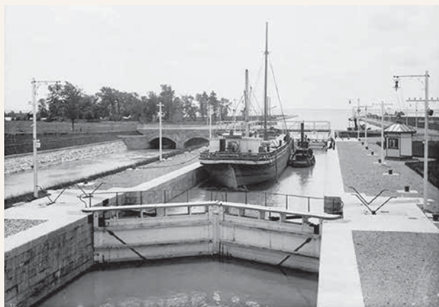
Barge et son remorqueur à Coteau-du-Lac (écluse numéro 5) après 1902.

Résumé de la conférence : Par le biais d'une intéressante sélection de photographies d'archives et d'informations historiques pertinentes, cette conférence vous fera revivre les différentes époques de fonctionnement du canal de Soulanges tout en contextualisant son importante valeur patrimoniale.